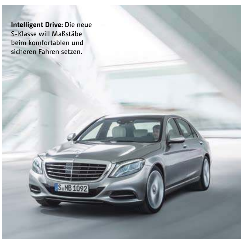
Intelligent Drive: Die neue S-Klasse will Maßstäbe beim komfortablen und sicheren Fahren setzen.

In den Bilanzkennzahlen dürfte langsam aber auch das vielfach verschmähte Zetsche-Programm „Fit for Leadership“ positiv zu Buche schlagen. Die Kostenreduzierung und die Produktivitätssteigerung laufen. Die Lkw- und Bussparte kommt gestärkt aus der Krise. Zugleich wird der massive Innovationsschub bei den herkömmlichen Pkw-Serien bis 2020 durch 13 völlig neue Modelle ergänzt. Und Zetsche ordnet das China-Geschäft endlich erfolgreich.