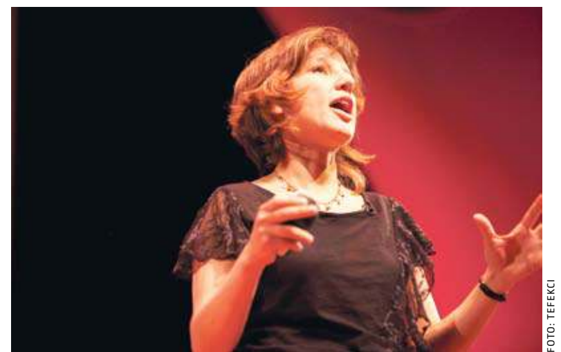
Google, Facebook & Co: Uni-Dozentin Zeynep Tufekci forscht zu kulturellen Effekten des technologischen Fortschritts.

Ich denke dabei an den Versuch von Google, mithilfe der Analyse von Suchanfragen die Ausbreitung von Grippewellen vorherzusagen. Es hat sich herausgestellt, dass Google mit sei-